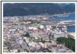
洲本市街【徒歩5分】 ▲三熊山頂上付近から見た洲本市街地