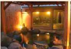
情緒あふれる露天風呂で日常の疲れを癒してください