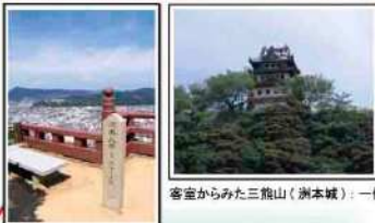
三熊山(洲本城)【徒歩40分】【お車15分】

天守閣まで 海月館からも見ることが出来る三熊山の頂上には洲本城が見えます。ここは夜はお城がライトアップされ、とても幻想的な雰囲気にもなれます。また洲本城は洲本温泉では当館でのみ見ることが出来ます。