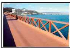
ボードウォーク【徒歩1分】

ホテルのほとんどのお部屋から望むことのできる大浜海岸は波も少なく心を穏やかにさせてくれます。釣り目的で来られるお客様も多く、釣ったお魚を料理していただき!なんてよくあります!