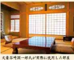
文豪谷崎潤一郎氏が実際に使用した部屋