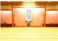
宿泊者全員が集まれる御宴会場。お食事やオリエンテーリングにご利用下さい