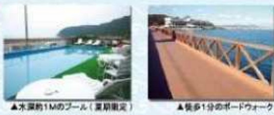
▲水深約1Mのプール(夏期限定) ▲徒歩1分のボードウォーク

お部屋から直接水着で泳ぎに行っちゃうなんてことが尿んとい出来る距離にあるのが大浜海水浴場です!もちろん海水浴だけでなく、近くの施設では釣りも楽しむことが出来ます。サビキなどの釣具もすぐ近くの釣具屋さんで借りることが出来るので、お子様でも気軽に楽しんでご利用頂けます☆